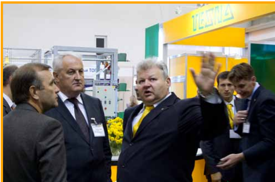
Animal Farming Ukraine – место встречи профессионалов агробизнеса