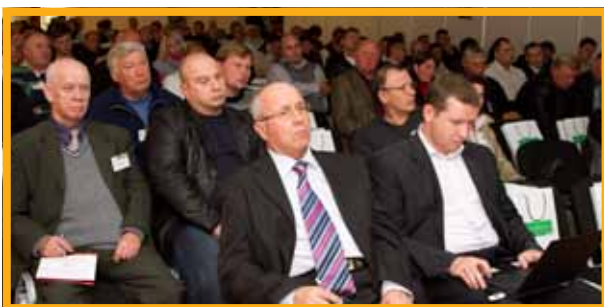
Animal Farming Ukraine – насыщенная деловая программа

В рамках выставки Animal Farming Ukraine проходит насыщенная программа конференций и семинаров, посвященных самым актуальным и значимым вопросам отрасли. Мероприятия посещают ведущие специалисты сферы животноводства и птицеводства, директора крупнейших хозяйств, птицефабрик и агрохолдингов