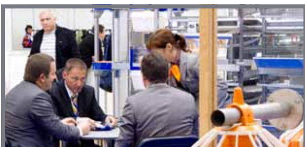
Animal Farming Ukraine – эффективные бизнес переговоры