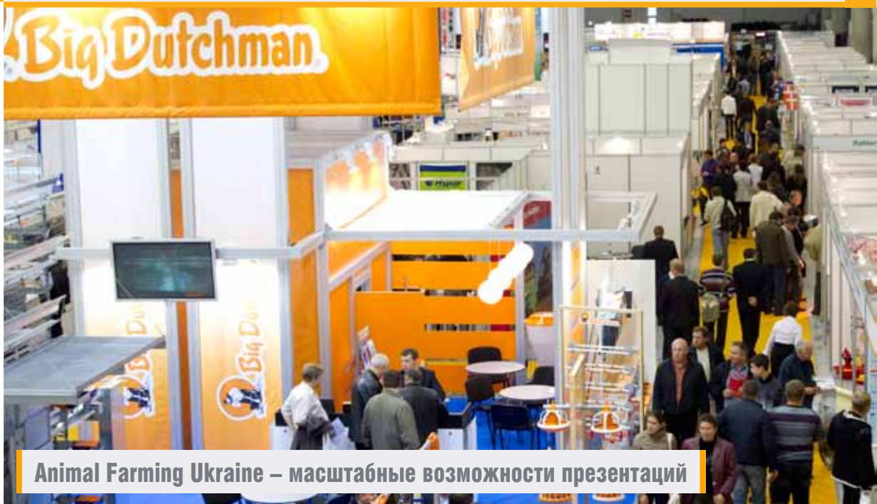
Animal Farming Ukraine – масштабные возможности презентаций