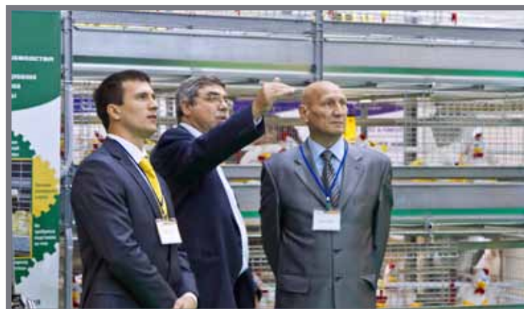
Animal Farming Ukraine – прямое общение с клиентами и партнерами